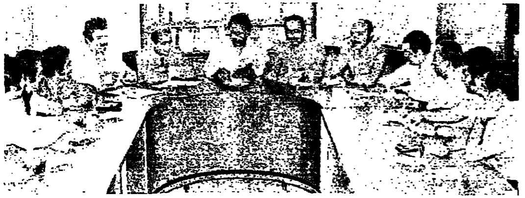
لجنة المثابرة أثناء اجتماعها بمقرها القاصد

وقررت اللجنة ان تعقد مؤتمرا صحفيا في النادي ، في مطلع السبوع المقبل ، لتبني في كيفية مجابهة الازمة مجابهة جديرة .